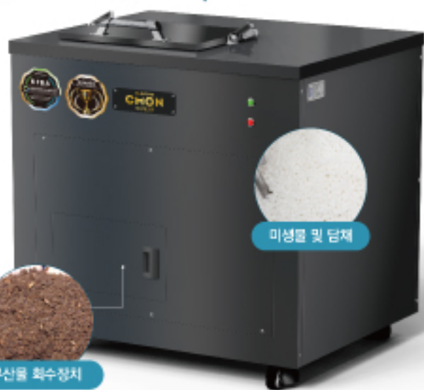
미생물 및 담체

24시간 이내 음식물 쓰레기가 하수도관을 통해 액상으로 배출 *음식물 종류에 따라 분해시간 상이